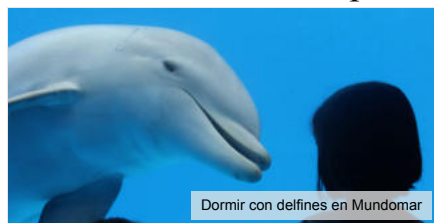
Dormir con delfines en Mundomar