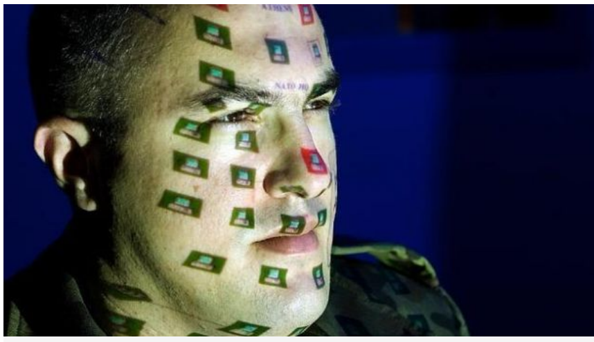
Consejos para sobrevivir a los fraudes en la Red

0 Comentarios Twitter 0 Recomendar 1 +1 0 Share